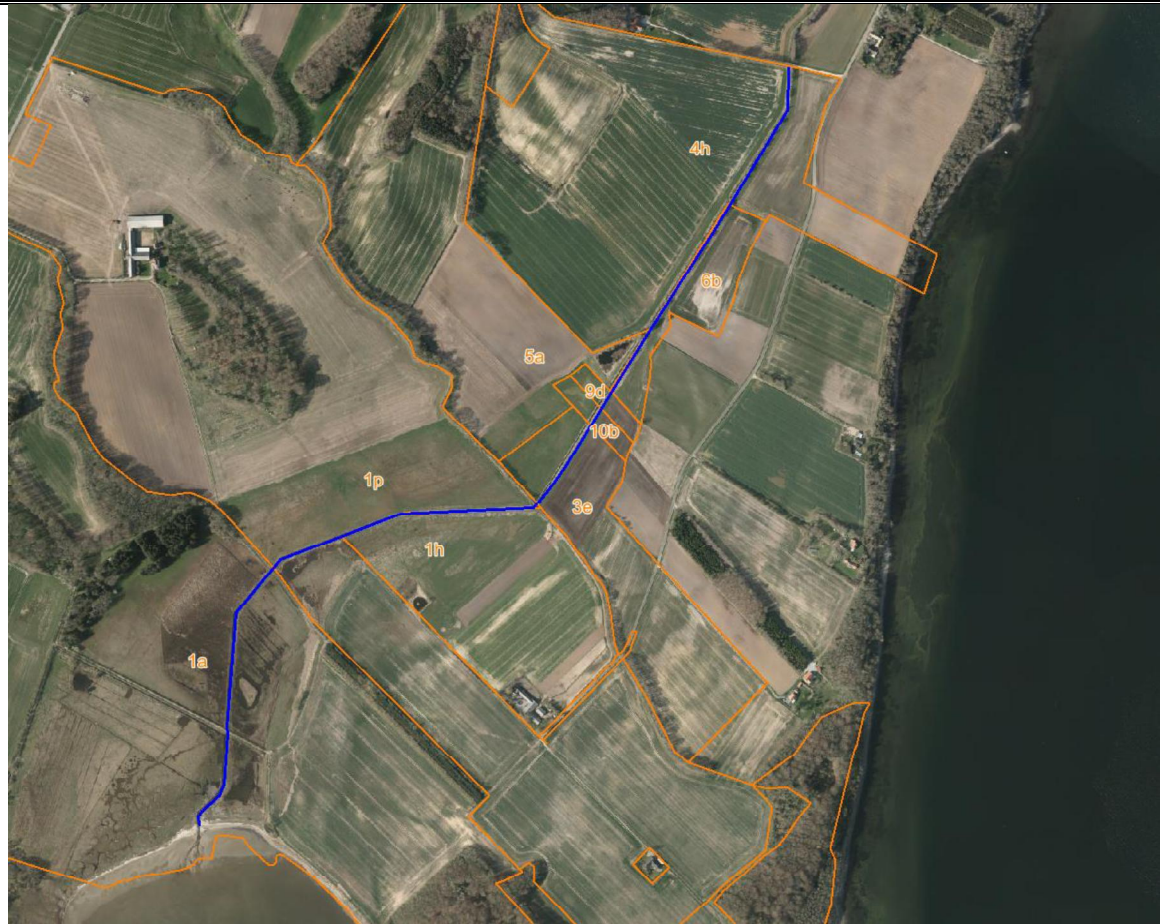
Figur 3 Luftfoto 2015 med matrikelkort langs den strækning af Mogenstrup Østre vandløb som ønskes oprenset.