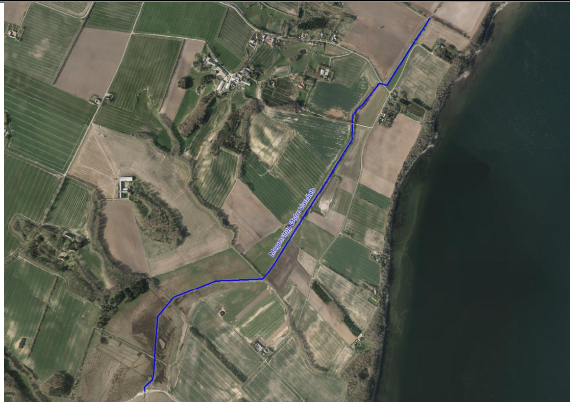
Figur 2 2015 luftfoto. Den blå linie markerer Mogenstrup Østre Vandløb.