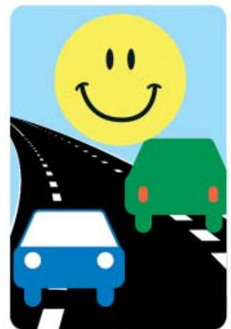
Skilte som opstilles langs vejen og forklarer køremønstret.