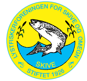
Lystfiskerforeningen For Skive og Omegn